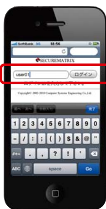
②ログイン ID 入力